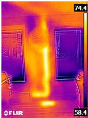
Warmes Abflussrohr in der Wand