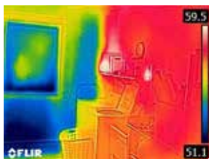
Nicht isolierte Außenwand