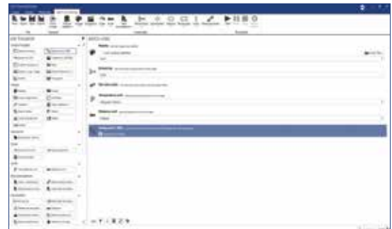
Sélectionnez des actions pour le traitement par lot