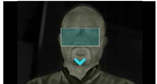
Automatischer Modus („Auto“)